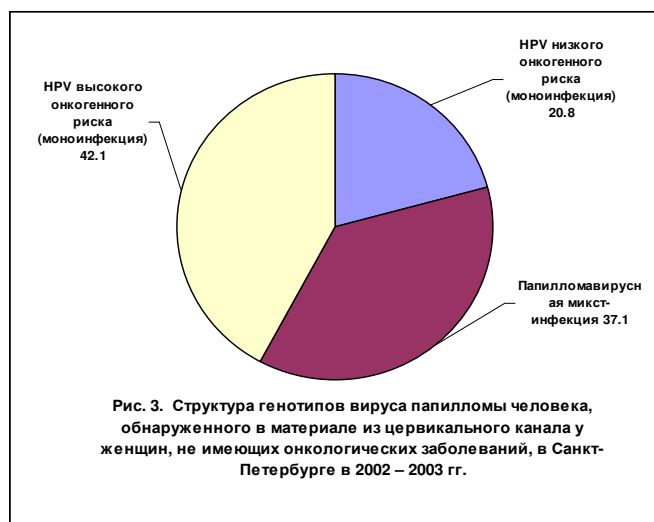
Рис. 3. Структура генотипов вируса папилломы человека, обнаруженного в материале из цервикального канала у женщин, не имеющих онкологических заболеваний, в Санкт-Петербурге в 2002 – 2003 гг.